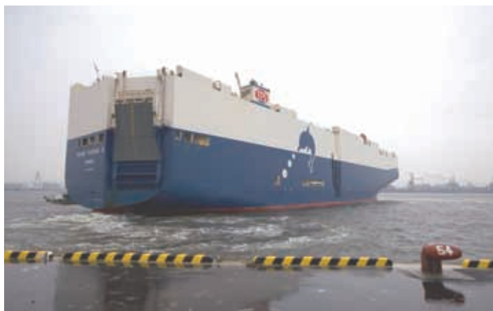
【名古屋港に入港するボランティア観測船 TRANS FUTURE 5 (12 ページ参照)】