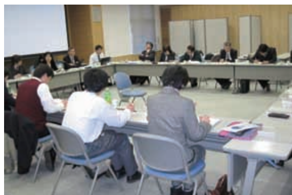
写真2 酸性雨広域大気汚染調査研究部会会議の様子

な影響を与えるかについて、常に監視するのが私たち全環研の責務です。そのために私たちは信頼性の高いデータを継続して提供していくことが大切と考えています。全環研酸性雨全国調査の成果も、他のさまざまな調査・研究の成果と共に、将来の環境に対する負荷を軽減するために活用されるものです。これからも、全環研酸性雨広域大気汚染調査研究部会では、信頼性の高いデータを収集し、解析を行い、東アジア地域からの影響についても明らかにし、わが国はもとより、EANETなどと連携してアジアの環境保全のためにも引き続き貢献したいと考えています。