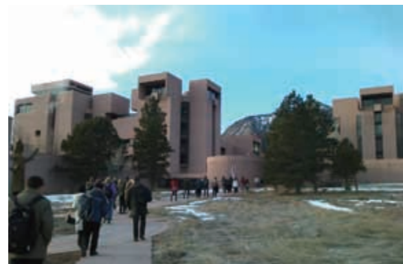
写真1 会議が行われた米国国立大気研究センター (NCAR)