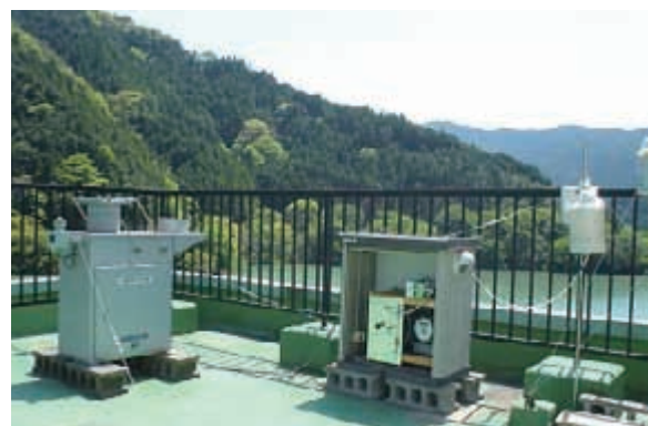
写真1 酸性雨捕集装置

酸性雨広域大気汚染調査研究部会では、これらの酸性雨調査のとりまとめと改善を行うため、会議を年2回開催しています。平成21年度第2回会議は、平成22年1月26日から27日に、国立環境